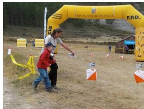
Orientierungslauf – etwas für groß und klein

Natürlich ist der kürzeste Weg nicht immer der schnellste, wie auch beim Autofahren!