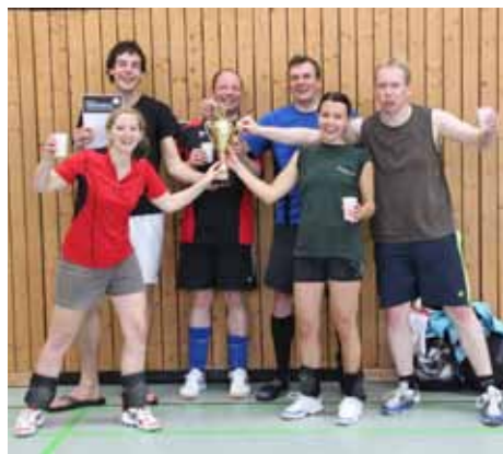
„Siegermannschaft Ein Geräusch“