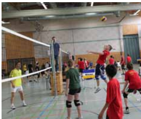
„Unsere Jugendlichen gaben immer alles“