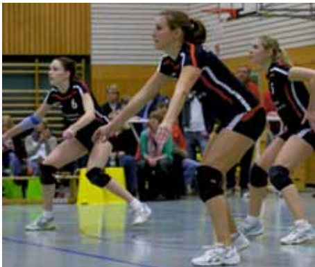
„Konzentriert bei der Annahme“

Die 1. Damen konnten ganz entspannt ihr letztes Heimspiel in der Oberliga gegen den TV Brötzingen angehen, nachdem sie sich durch vorangegangene Siege aus dem Abstiegs-kampf verabschiedet hatten. Durch eine konstante Leistung und hohe Einsatzbereitschaft hielten die Wieslocher Damen zu jederzeit das Spiel in den eigenen Händen und brachten den ersten Satz nach Hause. Auch wenn Brötzingen zu Beginn des zweiten Satzes in Führung lag, so brachte die eigene Leistung die Wieslocher wieder auf die Erfolgsspur zurück. Mit Unterstützung der Zuschauer hielt man das eigene Spielniveau auf einem sehr hohen Level und konnte so klar alle drei Sätze mit 25:21 gewinnen. Ein verdienter und klarer Sieg am letzten Heimspieltag war genau der richtige Einstieg für die Spielerinnen, um sich mit einem kleinen Blümchen bei den hervorragenden und stets zahlreich anwesenden Fans sowie allen Unterstützern und Förderer der 1. Damen zu bedanken. Am letzten Spieltag war man zu Gast in Konstanz und verlangte dem Tabellenzweiten noch einmal all seine Klasse ab, bevor man sich geschlagen geben musste. Gerade in den beiden letzten Sätzen unterlag man nur sehr knapp und unglücklich mit jeweils 24:26, war jedoch mit seiner eigenen Leistung und dem somit gelungenen Saisonabschluss sehr zufrieden. Mit dem 6. Platz und einem sehr frühzeitig gesicherten Klassenerhalt schauen alle trotz vielen Verletzungen und Ausfällen auf eine sehr schöne und gelungene Saison zurück.