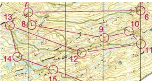
Ausschnitt der OL-Karte von der ersten Etappe (mit meiner während des Laufs aufgezeichneten GPS-Route)